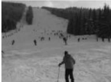
Figure 4. Pistes de ski pour la pratique des sports d'hiver.

Ces dernières années, dans la commune d'Arieșeni, le tourisme rural a pris une ampleur remarquable. Les pensions touristiques et agro-touristiques augmentent sans arrêt leur capacité d'hébergement et offrent des services des plus différenciés et compétitifs, afin de satisfaire aux exigences d'une clientèle de plus en plus diversifiée. Par conséquent, les touristes étrangers sont toujours plus nombreux, attirés par la piste de ski de Vârtop (exposée vers le nord et ayant de la neige d'abondance, 753 m de long, dénivellation de 218 m et chaise électrique) mais aussi par les nombreux objectifs naturels et anthropiques de la zone.