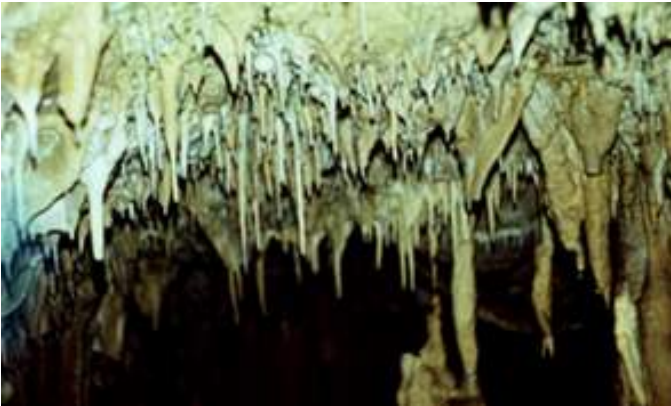
Figure 3. La grotte de Vârtop (village de Casa de Piatra).

Réservations spéléologiques. La grotte de Vârtop (village de Casa de Piatră) est une caverne fossile qui abrite des formations de stalagmites, écoulements pariétaux, concrétions calcaires et draperies d'une beauté à part, auxquels on ajoute la glace perpétuelle ayant une structure typique d'un rayon de miel qui y persiste jusque tard en été, et parfois d'une année à l'autre. La grotte est située au SE des Monts de Bihor. La réservation se trouve sur le versant puissamment incliné de la Colline de Vârtopaș, côté gauche du ruisseau de Gârdișoara, à côté du plateau karstique du voisinage de Poiana Clineasa, à une hauteur de 1170 m.