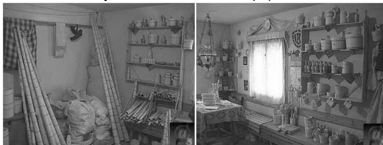
Figure 5. Valeurs ethno folkloriques.

Ces dernières années, dans la commune d'Arieșeni, le tourisme rural a pris une ampleur remarquable. Les pensions touristiques et agro-touristiques augmentent sans arrêt leur capacité d'hébergement et offrent des services des plus différenciés et compétitifs, afin de satisfaire aux exigences d'une clientèle de plus en plus diversifiée. Par conséquent, les touristes étrangers sont toujours plus nombreux, attirés par la piste de ski de Vârtop (exposée vers le nord et ayant de la neige d'abondance, 753 m de long, dénivellation de 218 m et chaise électrique) mais aussi par les nombreux objectifs naturels et anthropiques de la zone.