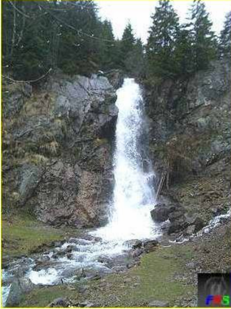
Figure 2. La chute d'eau Cascada Vârciog.

Réservations complexes. Les gorges de Gârdișoara (localité de Casa de Piatră) représentent une gorge sauvage à une longueur d'environ 1200 m où les eaux, stimulées aussi de la captation souterraine, ont rapidement crevé. Cette réservation complexe se trouve au SE des Monts de Bihor, dans le secteur supérieur de Gârda Seacă (appelée aussi Gârdișoara). Leur altitude maximale est de 1150 m.