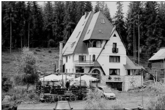
Figure 6. Types d'investissements pour le développement touristique.

Pour assurer le développement de l'activité de tourisme ainsi que la mise en valeur supérieure du patrimoine touristique, la nécessité des investissements pour le développement de la capacité d'hébergement, d'alimentation publique, traitement, transport, agrément etc., pour leur modernisation et leur diversification en fonction de la sollicitation manifestée, devient toujours plus évidente.