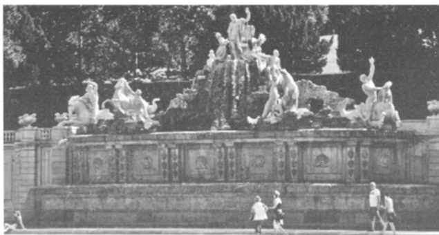
Fig.3. Fântâna lui Neptun – palatul Schönbrunn (jos) și fântâna arteziană – palatul de la Avrig, vedere dinspre NE (sus)